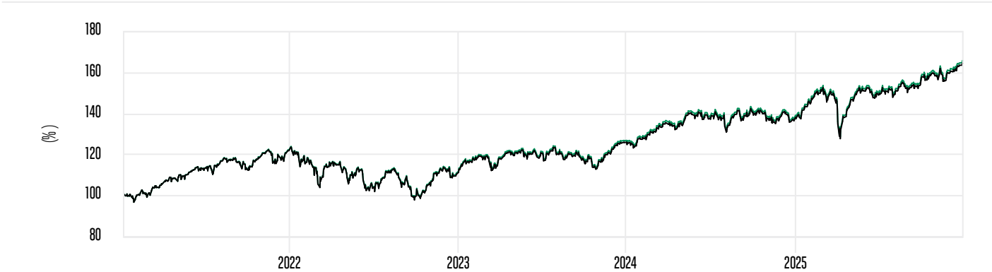
Performances cumulées au 31.12.2025 (en %)