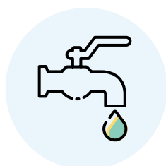
Pénurie de l'eau

Nous pensons que ce thème offre des opportunités de croissance à long terme, en raison de ces cinq grands moteurs de croissance convaincants :