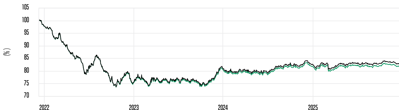
Kumulierte Wertentwicklung per 31.12.2025 (in %)