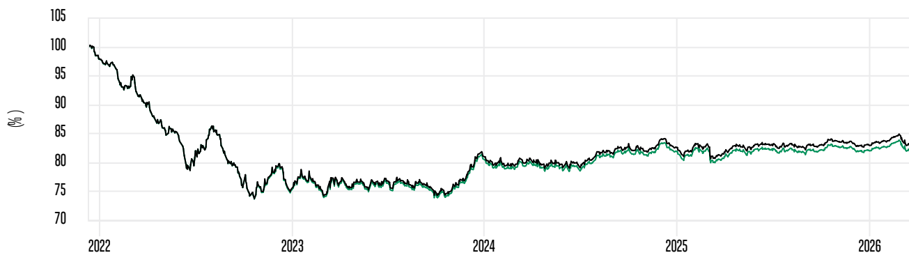
Kumulierte Wertentwicklung per 31.03.2026 (in %)